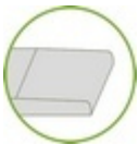
Bord Aminci (BA)